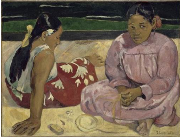
Paul Gauguin Femmes de Tahiti , 1891 [Mujeres de Tahiti] Óleo sobre lienzo, 69 x 91, 5 cm Musée d'Orsay, París Donación de la condesa Vitali en memoria de su hermano el vizconde Guy de Cholet, 1923 RF 2765

Tahiti , donde las siluetas de las mujeres están influenciadas por las formas simplificadas de Manet -a quien Gauguin admira- pero, sobre todo, los tonos vivos de los personajes, que anuncian el colorismo de Matisse.