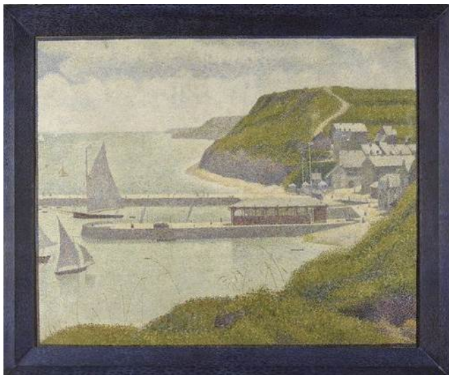
Georges Seurat Port-en-Bessin, avant-port, marée haute, 1888 [Port-en-Bessin, antepuerto con pleamar] Óleo sobre lienzo, 66 x 82 cm. Musée d'Orsay, París Adquirido con los fondos de una donación anónima canadiense, 1952 RF 1952 1

La obra de Seurat pronto sería apreciada por sus contemporáneos y tuvo importantes seguidores como Signac y el propio Pissarro, fundador y representante de la corriente impresionista, que incorporó a sus obras esta particular pincelada, como se puede apreciar en Jeune paysanne faisant du feu. Gelée blanche . Esta nueva forma de pintar a través de una pincelada ordenada y racional se opuso radicalmente a la espontaneidad de la pincelada impresionista. En 1887, Charles Angrand, Henri-Edmond Cross, y Maximilien Luce, se unirían al movimiento.